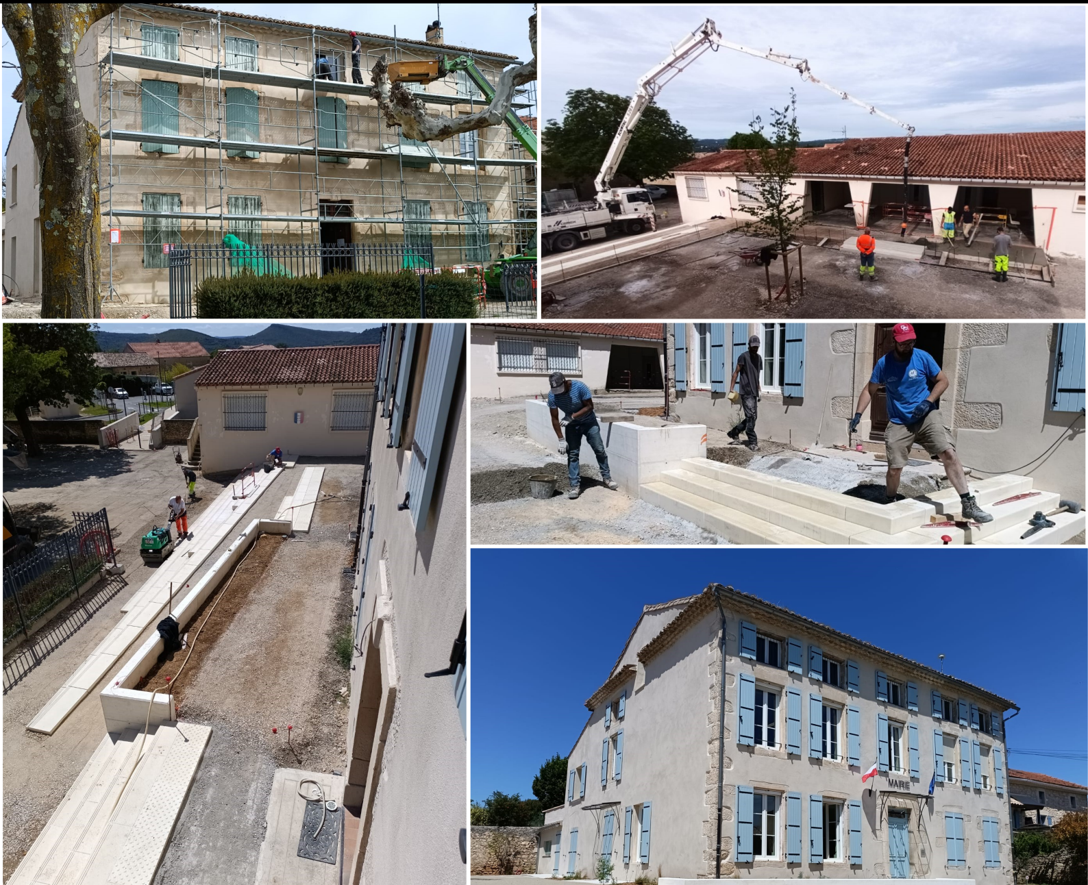
Travaux de la Mairie