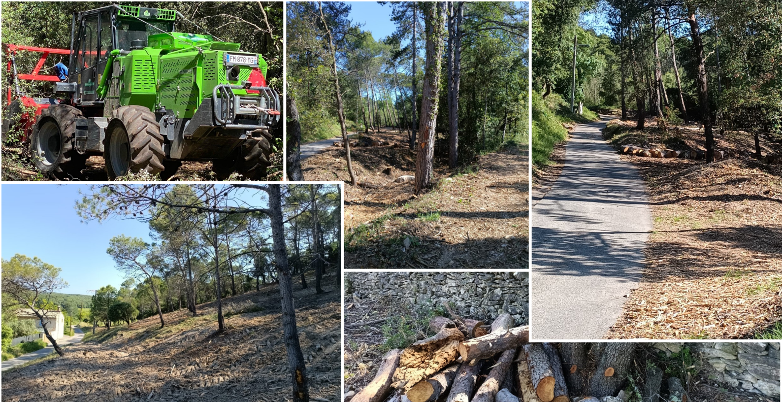
Obligations légales de débroussaillage