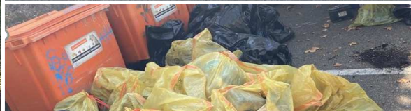
Saint Ger'Vert : une journée pour nettoyer la nature autour du village. Le succès serait de n'avoir pas besoin de faire une telle journée.