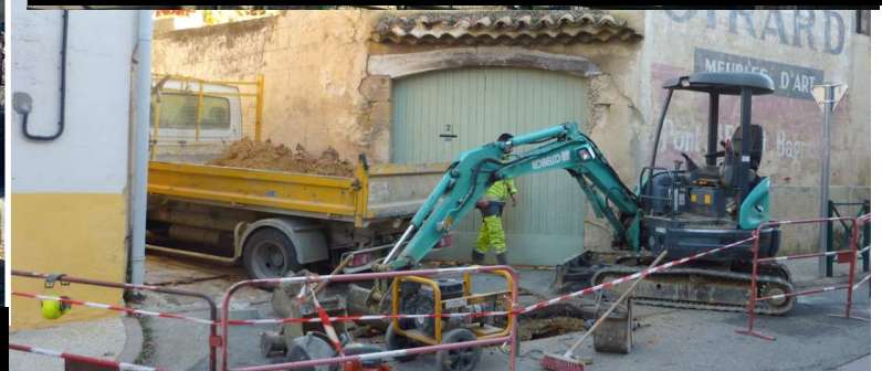
Travaux sur vannes et canalisations dans le cadre du Schéma Directeur