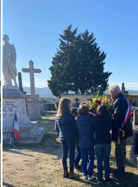
11 novembre: les enfants déposent une gerbe avec le Maire après lecture du message de la Secrétaire d'État