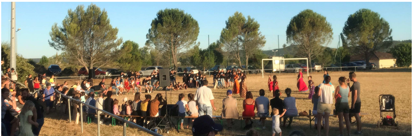
Le LNB danse au stade