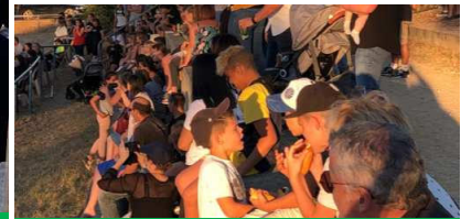
LNB : un public captivé