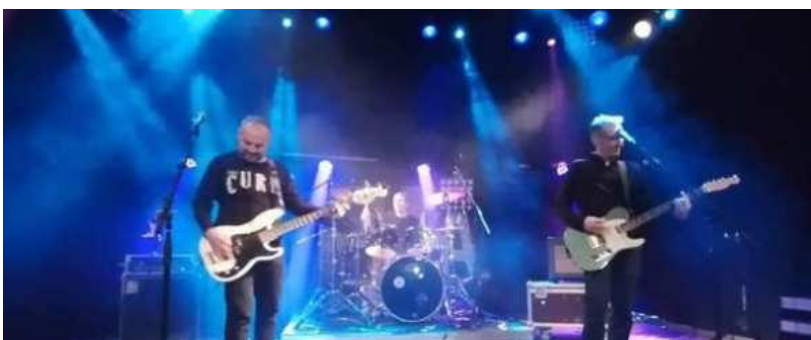
Un soir au marché nocturne, les SPYDRONES