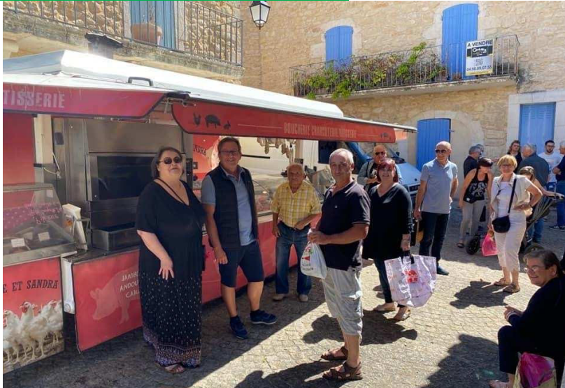
Le marché du dimanche : été comme hiver, on se rencontre tous !