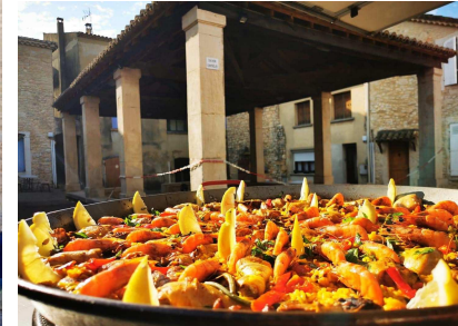
Un plat pour les gourmands