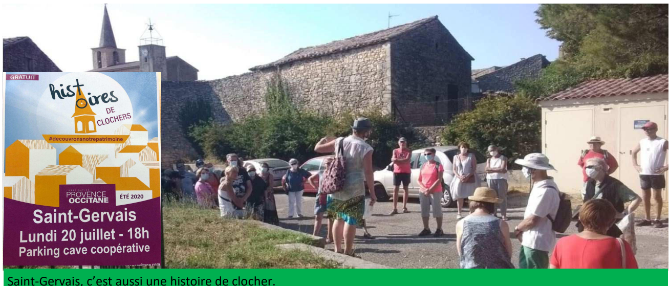
Saint-Gervais, c'est aussi une histoire de clocher.