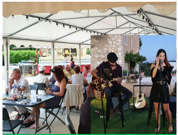
S'Armand, on y mange, on y chante !