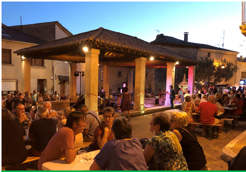
Les marchés nocturnes : tous les jeudis soir de l'été un concert