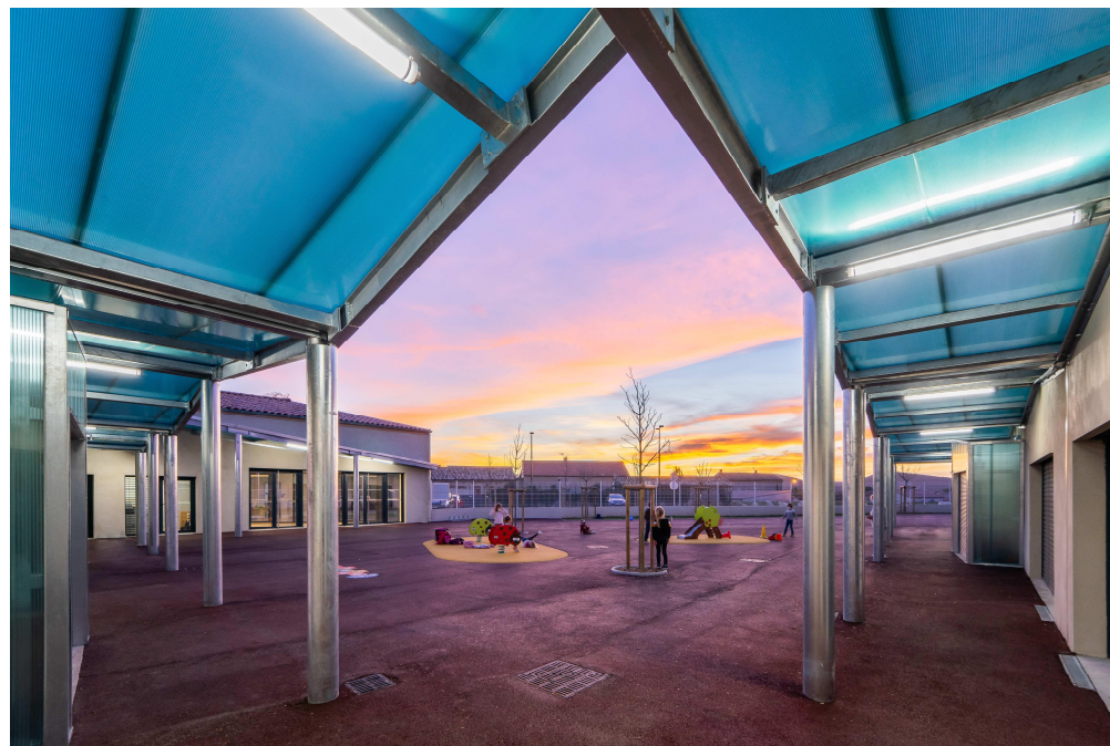
Coucher de soleil sur l'école