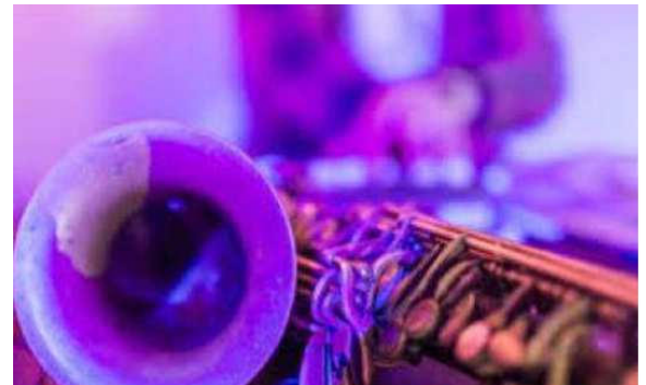
Marché nocturne : TOOTBLACK, 13/08/2020