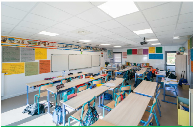
Une des quatre salles de classe